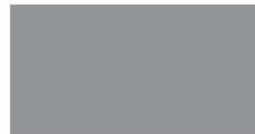
WP 02 - Abu-abu muda