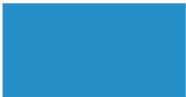
WP 04 - Biru