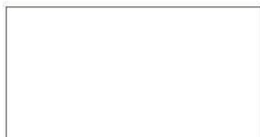
WP 08 - Putih